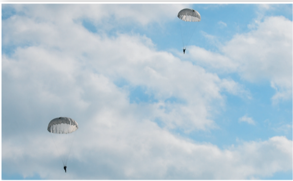
В течение 2020-2021 года проводилась работа по возобновлению прыжков с парашютом для перво-разников на аэродроме «Шушенский». Совместно с парашютной федерацией Хакасии, красноярским аэроклубом ДОСААФ нам удалось реализовать этот проект. 17-19 сентября 2021 года над аэродромом «Шушенский» впервые за 10 лет вновь раскрылись белоснежные купола. Новое поколение будущих парашютистов и десантников окунулось в небесную синеву!

Быстро и незаметно пролетел учебный год, насыщенный разносторонней учебной деятельностью. Пришел сентябрь, и это значит пришло время испытать небом повзрослевших кадет.