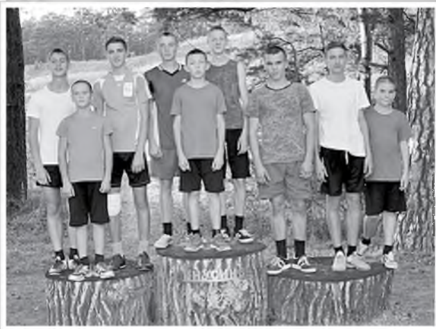
Подвижный, быстрый человек гордится стройным станом. Сидящий сиднем целый век подвержен всем изъяснам.